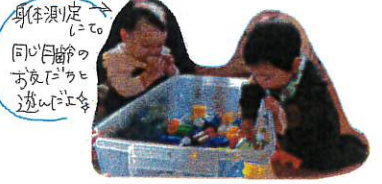
↑身体測定 して 同じ年齢の お友だちと 遊んでいる