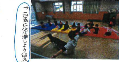
→元気に体操しよう(幼児)