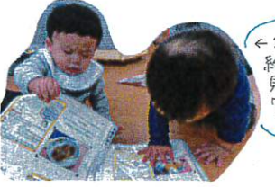
←2人で仲良く 絵本のページを 見ている お友だちだね!!