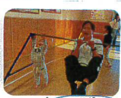
↑元気に体操しよう(乳児)↓