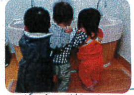
↑Mr.ベントナー保育園0歳児 お友だちも参加して...