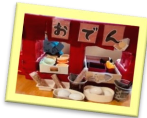
おでん屋さん開店!